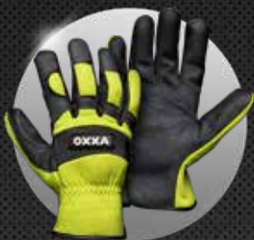
X-MECH-THERMO 51-615 Art. nr. 1.51.615.00