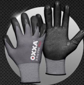
X-PRO-FLEX PLUS 51-295 Art.nr. 1.51.295.00