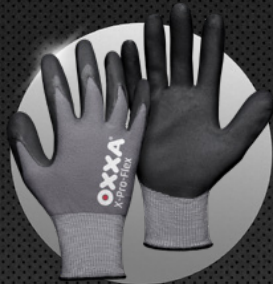
X-PRO-FLEX 51-290 Art.nr. 1.51.290.00