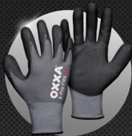
X-PRO-FLEX 51-292 Art.nr. 1.51.292.00