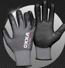
X-PRO-FLEX PLUS 51-295 Art.nr. 1.51.295.00